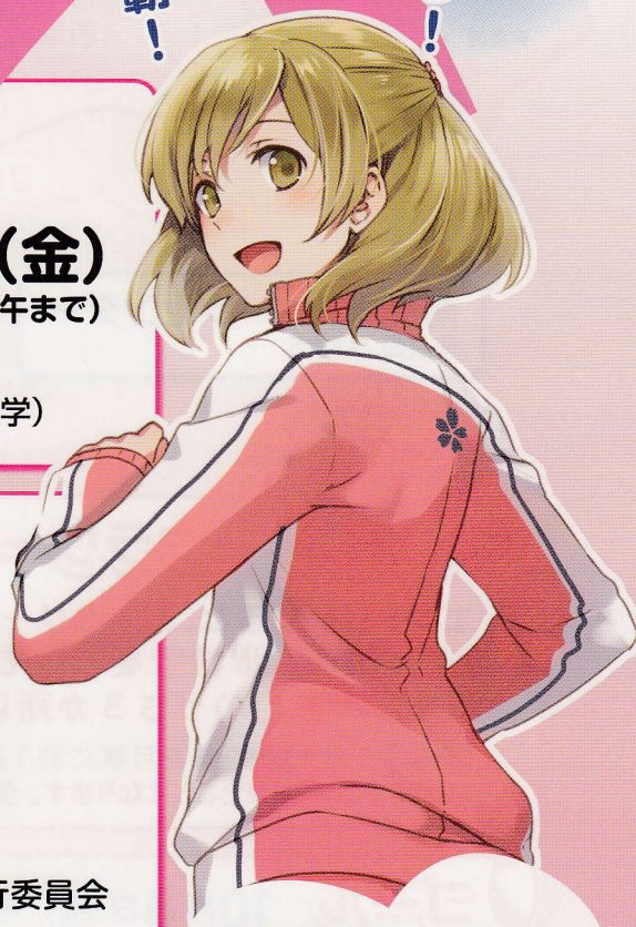
豊島区がん検診PRキャラクター