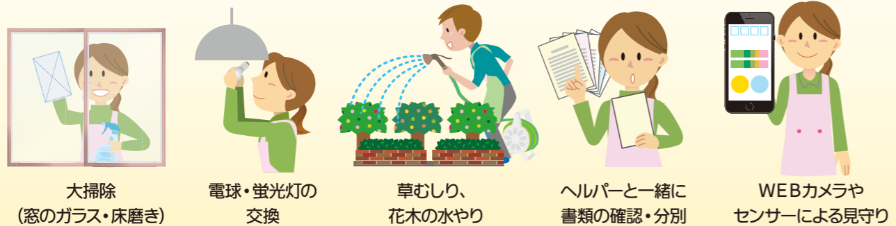
大掃除(窓のガラス・床磨き) 電球・蛍光灯の交換 草むしり、花木の水やり ヘルパーと一緒に書類の確認・分別 WEBカメラやセンサーによる見守り