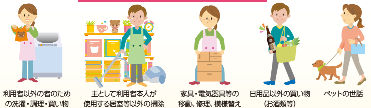
利用者以外の者のための洗濯・調理・買い物 主として利用者本人が使用する居室等以外の掃除 家具・電気器具等の移動、修理、模様替え 日用品以外の買い物(お酒類等) ペットの世話